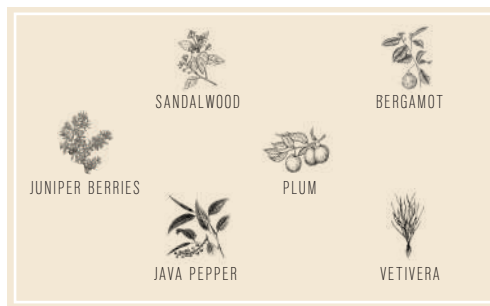
▲ “中でも特に特徴的な 6 つのボタニカル”

コニャック産のぶどうをベースに、ジュニパーベリー、カルダモン、ジンジャー、サンダルウッド、ベルガモット、プルーン、など 14 種のボタニカルを使用しより複雑でスパイシーな仕上がり。ウッディーなニュアンス付けのため、ジンにサンダルウッド（白檀）とベチバー（従来香水によく使われるハーブ）を取り入れました。